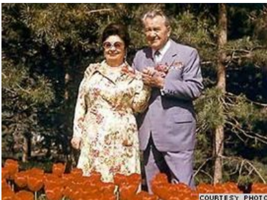
Динмухамед Кунаев со своей женой. Алматы, 1982 год.

нем высечено: «Дорогим родителям... от детей 1973 год». Чем знамениты ее родители?