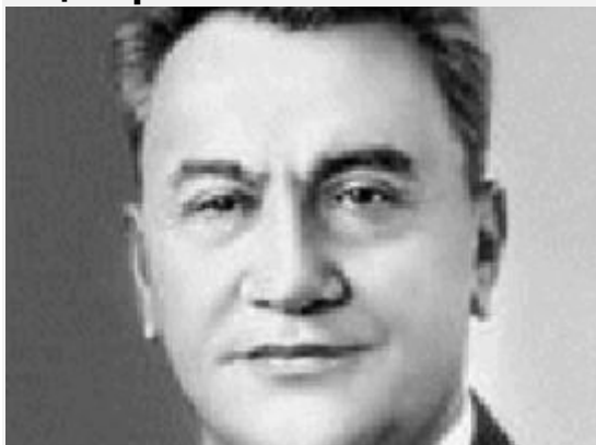
Лидер Советского Казахстана Динмухамед Кунаев.