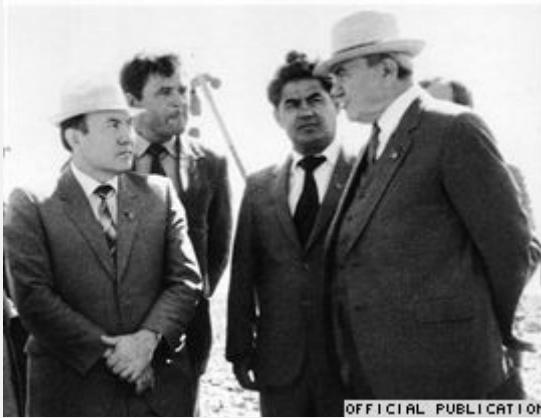
Нурсултан Назарбаев (слева) и Динмухамед Кунаев (справа).

Назарбаев подверг его критике за оторванность от реальных потребностей жизни, подбор кадров и так далее.